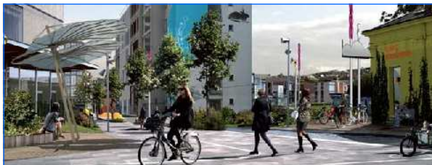
Reconversion de l'hôpital Saint-Louis

Plusieurs sites dans Evreux sont destinés à offrir des services de santé et bien-être.