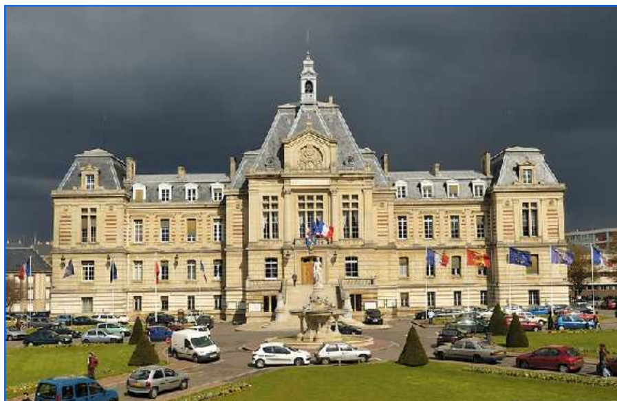
La place de l'Hôtel ville sera réaménagée en une grande place publique et polyvalente

La nature est déjà au cœur de la vie quotidienne puisque Evreux est la seule ville de France à être dotée d'un berger municipal, les moutons se chargent de l'entretien de certains espaces verts. Ils paissent sur les coteaux de Saint-Michel et de