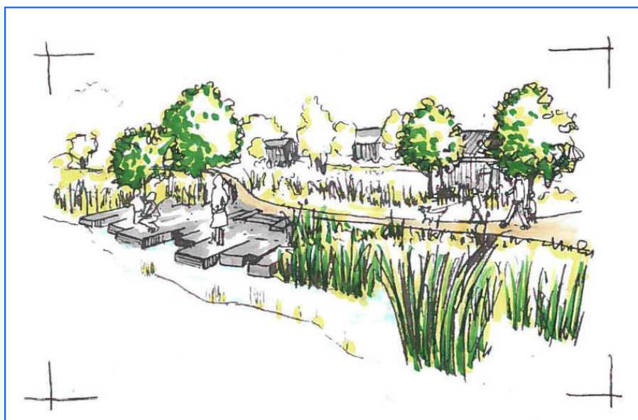
Evreux croquis d'ambiance du futur espace de Navarre

La ville a eu la chance lors de sa reconstruction de bénéficier des travaux de Pierre Dupont, un ébroïcien, architecte exceptionnel qui malgré les faibles moyens financiers dont il disposait pour les projets, a cherché une architecture « raisonnable » qui